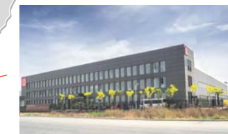
RINGSPANN Power Transmission (Tianjin) Co., Ltd., China