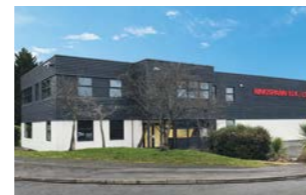
RINGSPANN (U.K.) LTD., Großbritannien