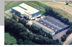
RINGSPANN Kempf GmbH, Deutschland Werk Gelenkwellen