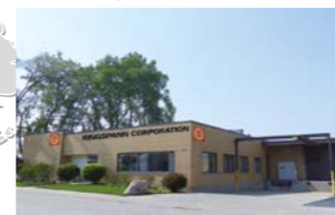
RINGSPANN CORPORATION, USA