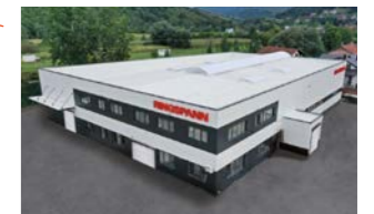
RINGSPANN Bosanska Krupa d.o.o., Bosnien und Herzegowina