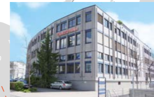
RINGSPANN AG, Schweiz