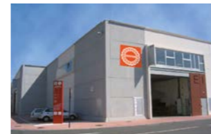
RINGSPANN IBERICA S.A., Spanien