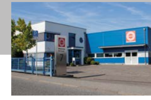
RINGSPANN RCS GmbH, Deutschland Werk Fernbetätigungen