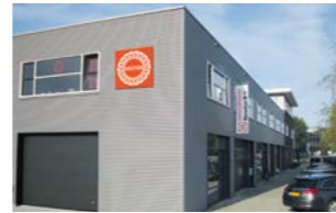
RINGSPANN Benelux B.V., Niederlande