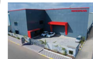
RINGSPANN Power Transmission India Pvt. Ltd., Indien