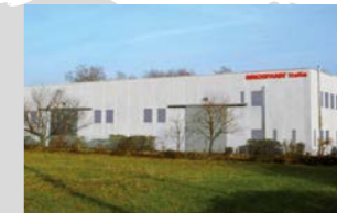
RINGSPANN Italia S.r.l., Italien