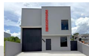
RINGSPANN do Brasil Ltda., Brasilien