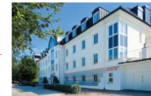
RINGSPANN Nordic AB, Schweden