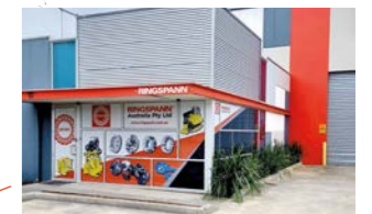
RINGSPANN Australia Pty Ltd., Australien